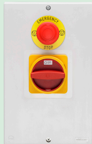
Gekapselter Lasttrennschalter (IP66) mit zusätzlichem Not-Aus-Drucktaster